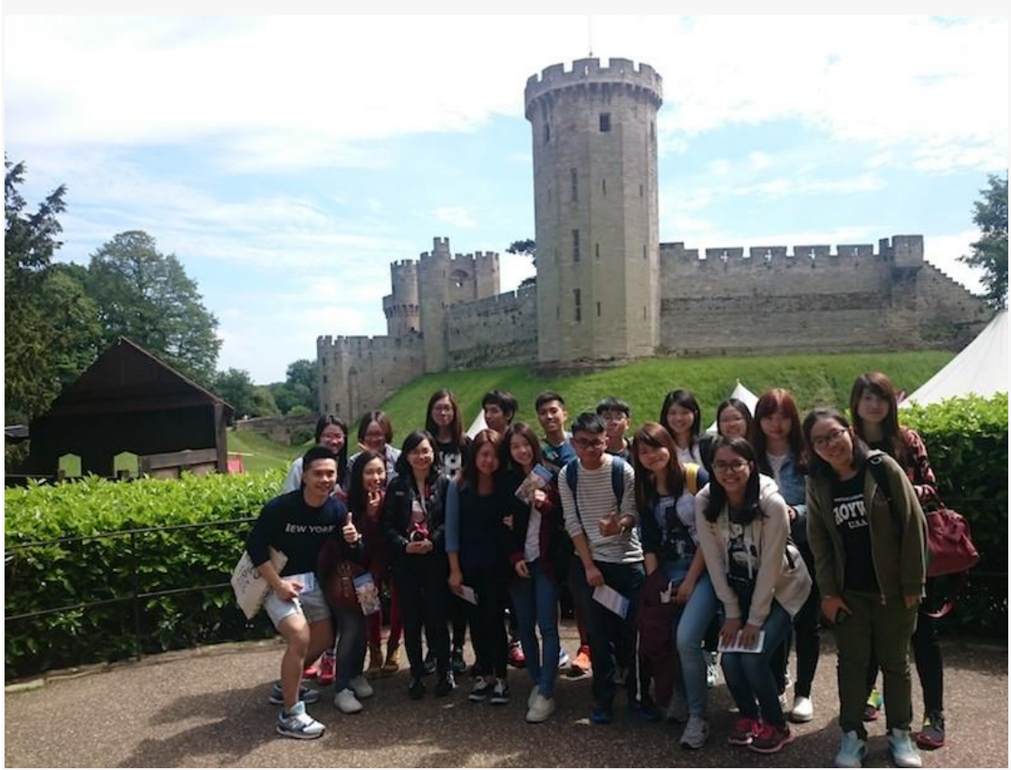
公開大學與英國華威大學合辦「英語及文化浸沉課程」，讓同學到訪英國華威大學，參加文化研討會、英國文化課及文化教育遊。